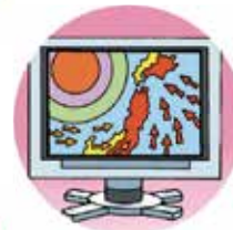
気象警報・注意報